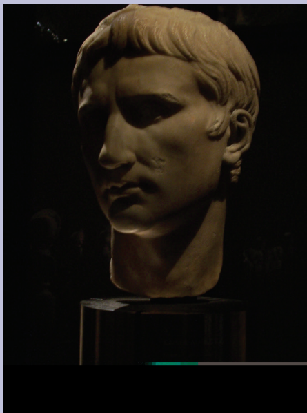
Augustus, Gaius Octavius Thurinus (63 BC-14 AD)