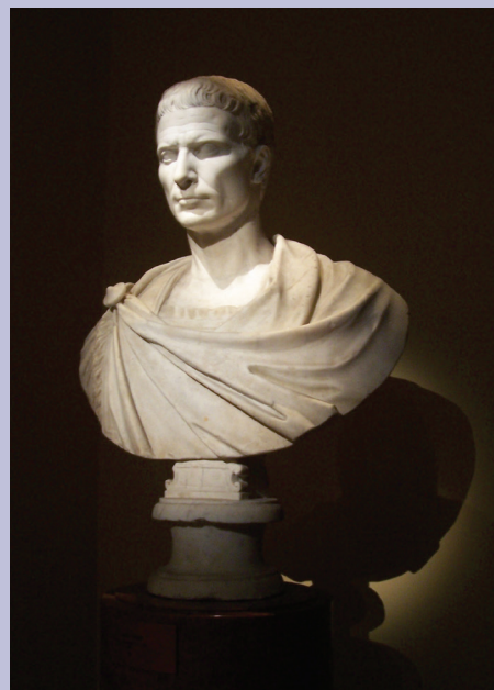
Gaius Julius Caesar (100-44 BC)

10 Este vorba de Otto Hauser (1874-1932).